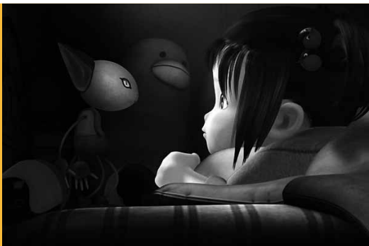
Yona, la légende de l'oiseau sans ailes