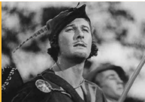
Les Aventures de Robin des bois