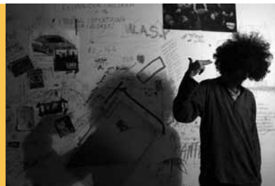
Les Chats Persans